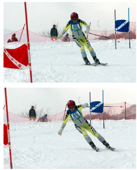
ターン前半のイメージ

「えっウソ、ホント!?!」といった、かなり奇抜な発想の転換を迫られる内容も多々含まれていたと思います。この後さらに「洗練から発展」へと進めていきたいと思いますが、これまでの疑問や質問、意見、感想など寄せていただき、ここから先はみんなで考える「二軸スキー」にしていきたいと考えています。